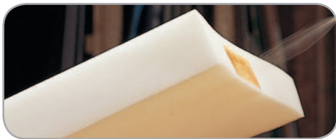
3M™ Adhesivo en aerosol 24 para Espumas y tejidos ideal para aplicaciones de tapicería.