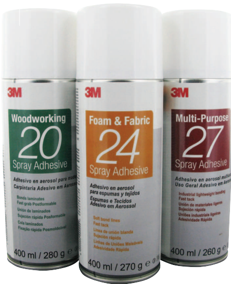
3M™ Adhesivo en aerosol 20 para Madera 3M™ Adhesivo en aerosol 24 para Espumas y Tejidos 3M™ Adhesivo en aerosol 27 de Uso general