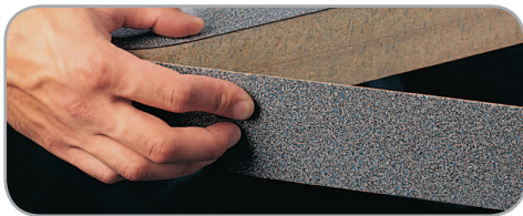
3M™ Adhesivo en aerosol 20 para Madera es un adhesivo fuerte ideal para el pegado de laminados, enchapados y muchos otros trabajos con madera.